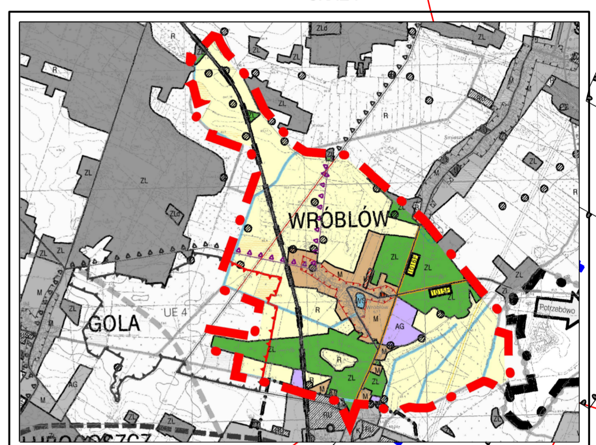
Wyrys ze studium uwarunkowań i kierunków zagospodarowania przestrzennego gminy Sława