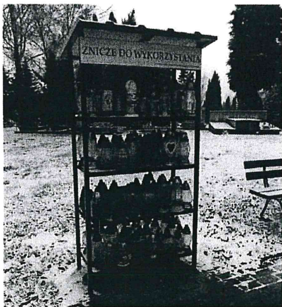
Zniczodzielnia w Międzyrzeczu: