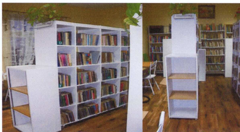
Filia w Lipinkach

zużycie materiałów i artykułów - materiały do remontów i naprawy sprzętu - w pozycji tej ujęte koszty zakupu farby do przemalowania regałów i kółek do regałów oraz wykładziny podłogowej PCV na filię w Lipinkach.