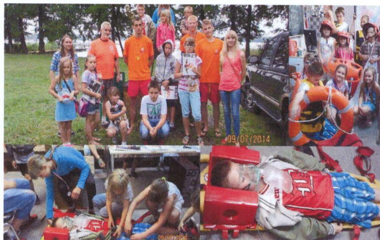
Wycieczka do Ratownictwa Wodnego Sława

Starszym członkom naszej społeczności zaproponowaliśmy w tym roku udział w kursie komputerowym oraz w projekcie „O finansach... w bibliotece – III edycja”, którego odbiorcami były osoby 50+. W szkoleniu wzięło udział 20 osób. Odbywało się ono w dwóch grupach 10 osobowych w Sławie i Starym, Strączu. W ramach tego projektu biblioteka przystąpiła do konkursu – na najciekawszą historię uczestnika kursu „O finansach... w bibliotece – III edycja”.