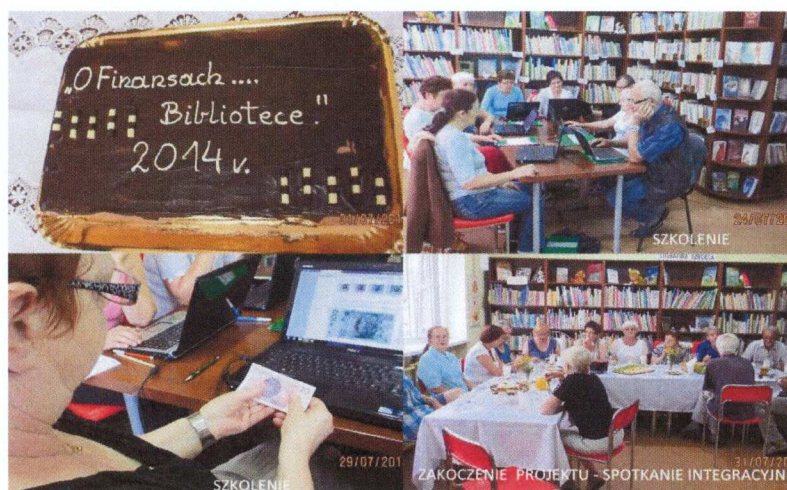
O finansach w bibliotece

Istotne było to szkolenie dla uczestników, gdyż nauczyli się poruszać w świecie finansów i bankowości elektronicznej, poznali wiele przydatnych aplikacji, a jeżeli niektórzy już się poruszali, to zapewne po tym szkoleniu czują się pewniej. Jedna z uczestniczek opowiadała, że po tym szkoleniu założyła sobie kilka kont w banku, dla kolejnej osoby było ono mobilizujące, aby podjąć decyzje kupna komputera którą rozważała od dłuższego czasu. Biblioteka dzięki temu działaniu pozyskała 3-ech aktywnych czytelników w tym jeden z nich został również aktywnym członkiem DKK. Na zakończenie tego projektu dla uczestników zorganizowaliśmy uroczyste integracyjne zakończenie w bibliotece w Starym Strączu. Organizacja tego zakończenia była dla nas wyzwaniem i również nowym doświadczeniem z którego wyszliśmy z przeświadczeniem, że potrafimy coś takiego zorganizować i kolejne takie działania będziemy podejmować już z mniejszą obawą.