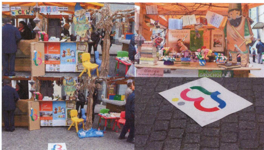
Stoisko biblioteki na jarmarku

Biblioteka Publiczna w Sławie w omawianym roku brała udział w konkursie „CSR – dziesięć na dziesięć” organizowanego w ramach akcji Pekaes Pomaga i zgłosiła do programu filię w Lipinkach. Program polegał na codziennym głosowaniu przez mieszkańców gminy Sława (i nie tylko) na zgłoszone biblioteki przez okres od 15 października do 5 listopada 2014 roku. Jednym z wymogów tego programu było posiadanie konta pocztowego przez osobę głosującą. Biblioteki z całego kraju ubiegały się o wyremontowanie swoich pomieszczeń ufundowanych przez partnerów akcji. Niestety nie udało nam się dostać do pierwszej dziesiątki, ale samo doświadczenie wynikające z faktu brania udziału w akcji, zaangażowania społeczności dało nam doświadczenie w tego typu działaniach, które możemy wykorzystać w przyszłości. Uczestnicząc w tej akcji jednocześnie zaobserwowaliśmy zaangażowanie społeczne w tego typu działania, problemy, które wystąpiły i uniemożliwiły niektórym udział w działaniu np. brak konta pocztowego.